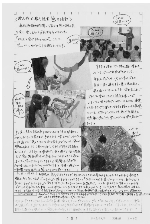
【図1】 担当した実習生の＜ドキュメンテーション型＞日誌