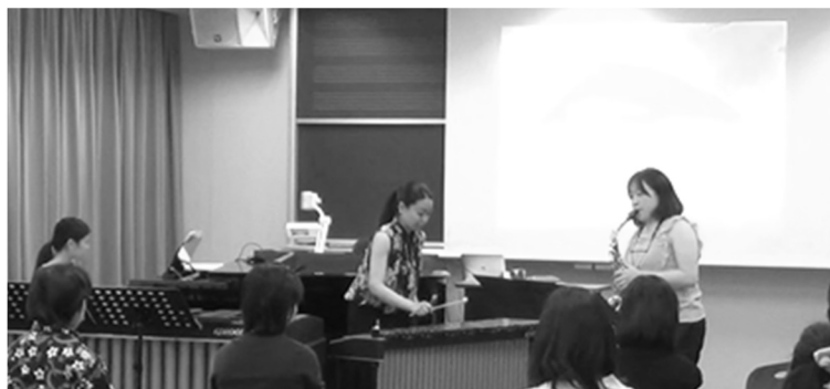
Photo 1 Appreciation via Performances