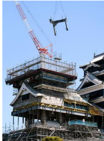
写真：復興が進む熊本城（朝日新聞より）

熊本県には地震とは無縁の国という安全神話があった。2016 年 4 月の地震は最大震度 7 の前震と本震が立て続けに起きことで心理的ダメージが大きかった。本震後の余震の回数の異例な多さも熊本地震の特徴である。気象庁の地震の命名や発表が二転三転したということは通常の地震概念（本震が 1 回あってその後は余震が減衰する）では理解出来ない未曾有の地震であったことを意味する。本震並みの地震がまたくるかもしれない、余震が終わらないかも知れないといった恐怖や不安は想像に難くない。車中泊の圧倒的な多さはこうした事情を物語っていると考えられる。過去の地震と比較すると熊本地震の特徴がわかる。