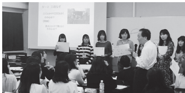
写真2：模擬授業形式の講演風景