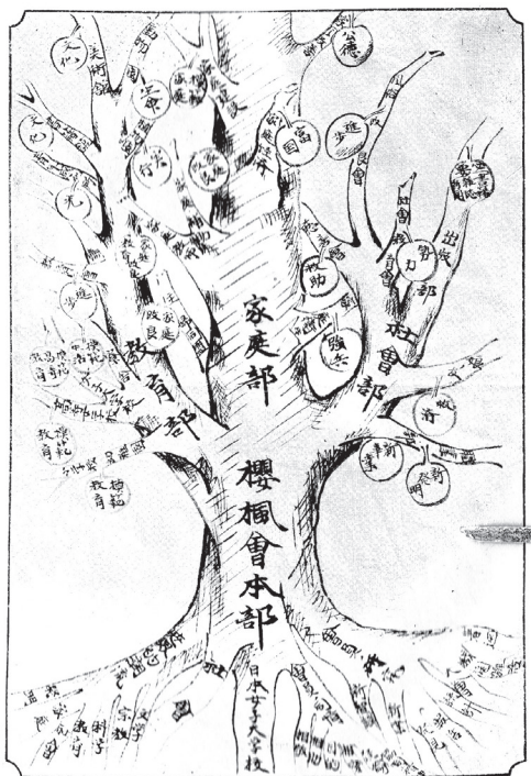
図2：創設期の桜楓会組織

即ち会の本部を幹とし、此の幹は家庭部、教育部、社会部の三大枝に分る。各枝は更に数多の